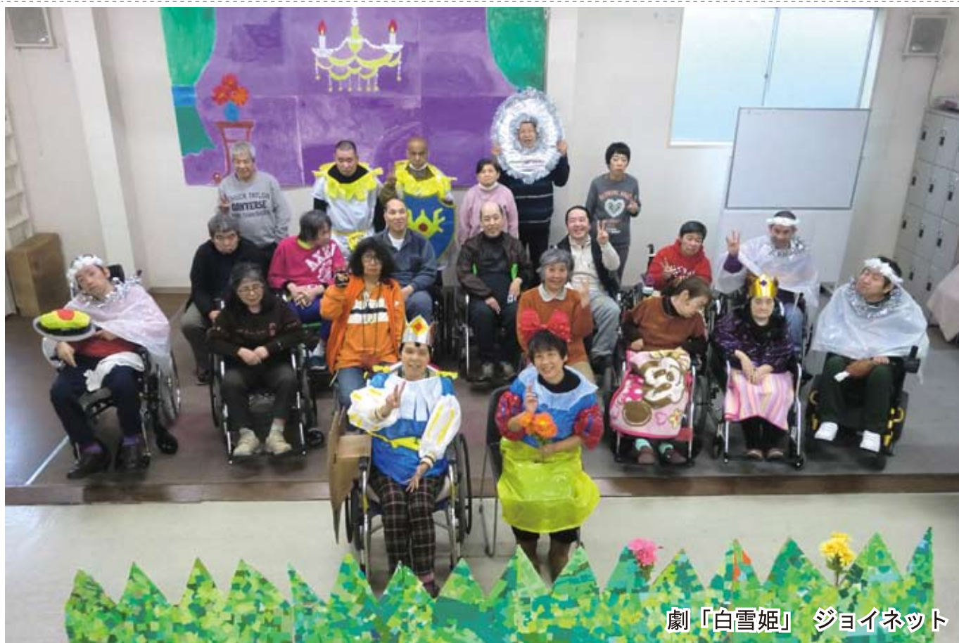
劇「白雪姫」 ジョイネット