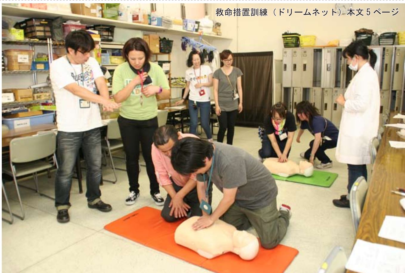
救命措置訓練（ドリームネット）本文5ページ