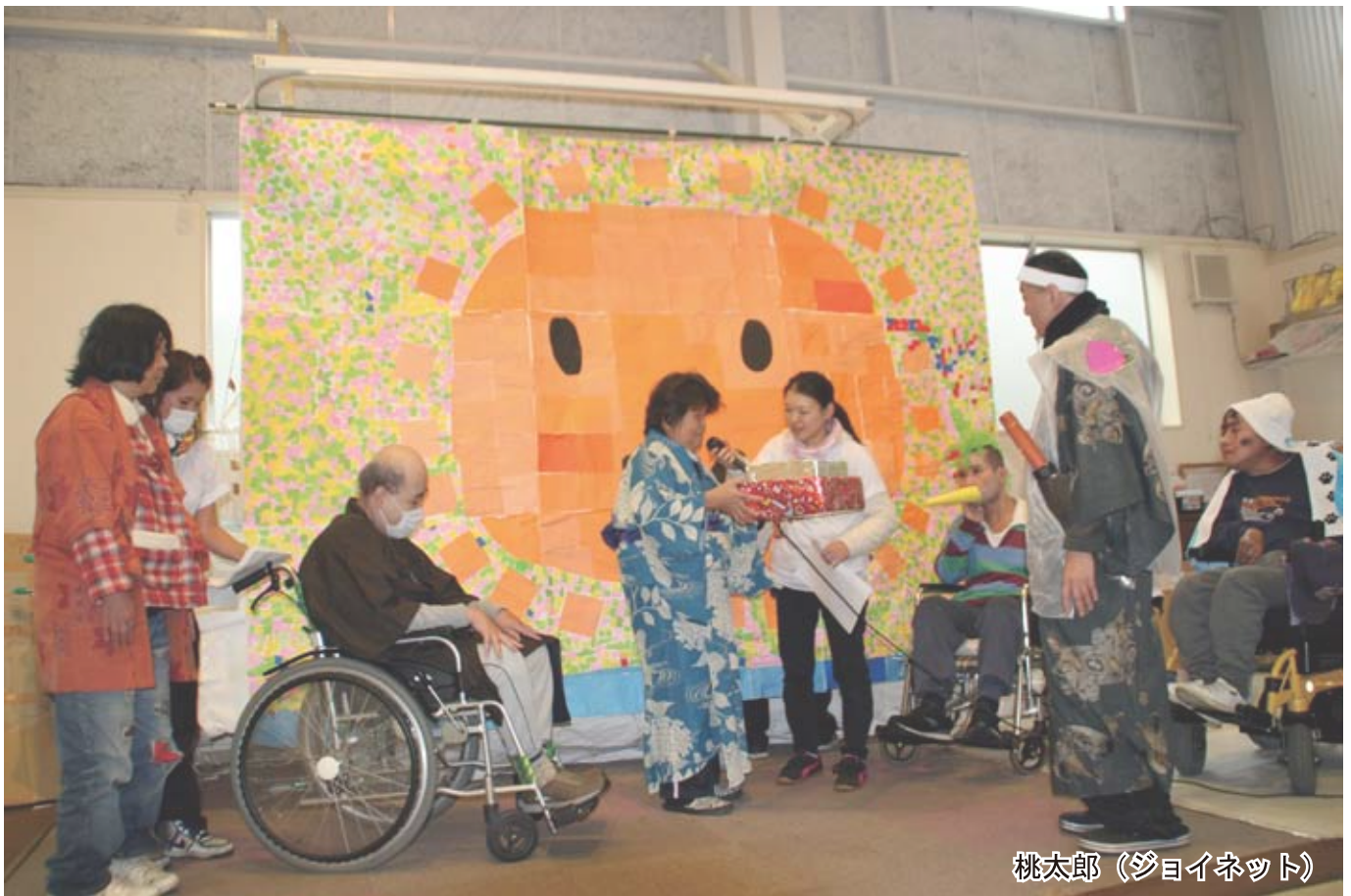
桃太郎（ジョイネット）