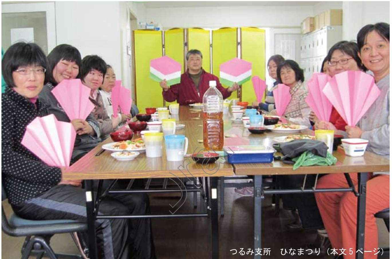
つるみ支所 ひなまつり (本文5ページ)