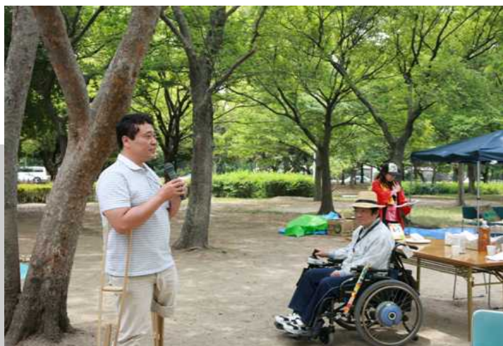
あいさつする理事長