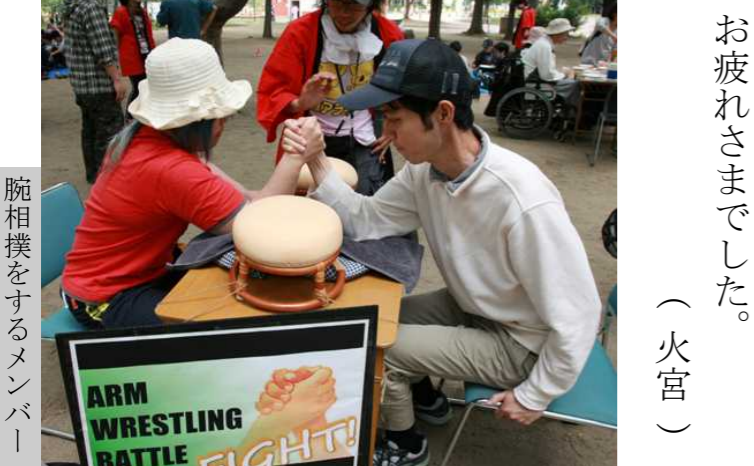
腕相撲をするメンバー

員が一番気に掛けたのは、やはり当日の“お天気”だったかも知れませんが、実は、冒頭の挨拶よりも三時間前からこの日は始まっていました。その朝が晴れならば、ほぼ始発による先遣の現地確保。七時半には設営舞台が現地入り。机・椅子・シートに加え、今回メインのバーベキューコンロやアトラクション部材等々が次々と搬入されていくという段取りでした。調理のほとんどが屋外になる厨房関係者は、いつも増して気合が入っていました。