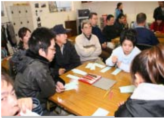
みんなで俳句を考えています

作りの時間に一生懸命に頭を振りしぼって一句一句完成させる方など様々でした。昨年もこの俳句大賞に翔夢で創作俳句を投句し、みごとに二名の方が佳作として入選しました。今年も多くのの方が素晴らしい俳句を作ったので必ず良い結果が出ることに期待をしています。 また今回は、俳句づくりが苦手な方でも楽しめるように俳句をもとにしたゲームも同時に行われました。グループごとに分かれば季語も関係なく好きな俳句を作ってもらい、その俳句を「五・七・五」の区切りで三つに切り離し、シャッフルして別の