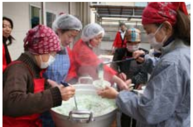
七草粥であつたまります

すいとこなして行きました。 早々と来たメンバーなどは待ち きれない様子で、準備をしてい るもち米を見て『早くつきて 』オーラを十二分に出してい たので予定より少し早めにもち つきを開始し、力自慢の？メン バーや地域の人が順々にもちを ついていきました。休日開催と 宣伝の効果もあり地域の人参加 も去年よりは多少増えていたよ うで、来ていただいた方には一 緒にもちをついて頂いたりおみ やげを持ちかえっていただきし た。 もちの種類もきな粉やえび