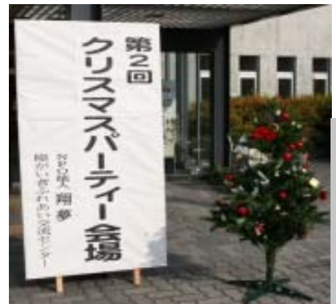
会場前の立て看板

十二月二十六日、平野区民センター（コミュニティプラザ平野）で第二回「翔夢クリスマス会」が行われました。 当日は二〇〇人近い参加者があり、みんなでクリスマス会を楽しみました。