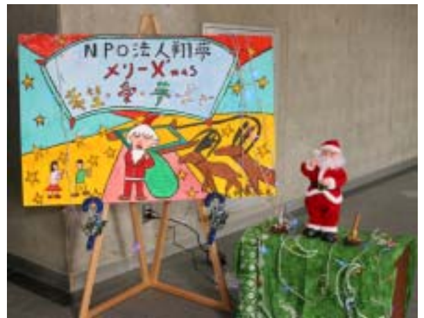
利用者の方が書いたウェルカムボード

クリスマス会の準備を始めたのは十一月に入ってからでした。今回は、地域に開かれた施設への思いから、多くの方に参加して頂きやすい土曜日にとのことから一日おくれの十二月