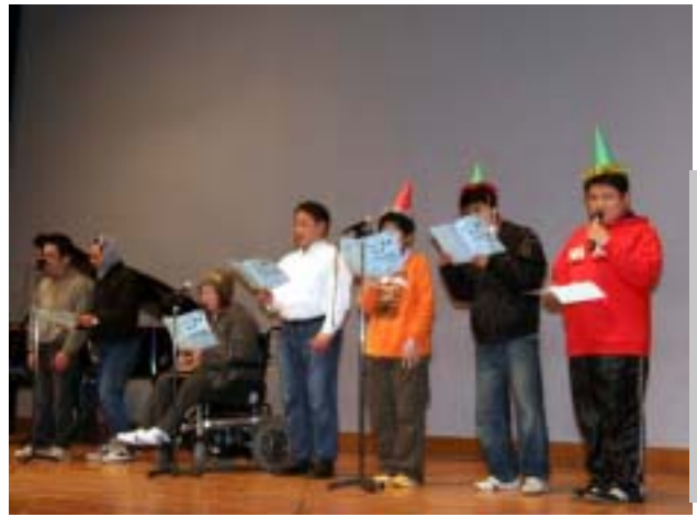
オープニングの合唱