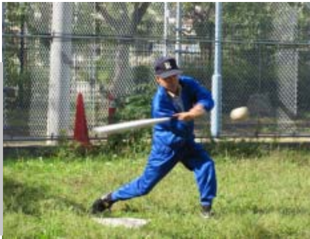
バッティングを鍛えて 優勝を狙います

ベリーカップを四月に控え、ソフトボール倶楽部の士気も日に日に高まっています。ベリーカップは、毎年四月に大阪市精神障がい者支援職員連絡協議会の主催で行われる作業所対抗のソフトボール大会です。NPO法人「翔夢」はハートネットとして過去に準優勝の成績を残してきました。そして今年、メンバーが声を掛け合い発足した「翔夢ソフトボール倶楽部」として初優勝を目指します。