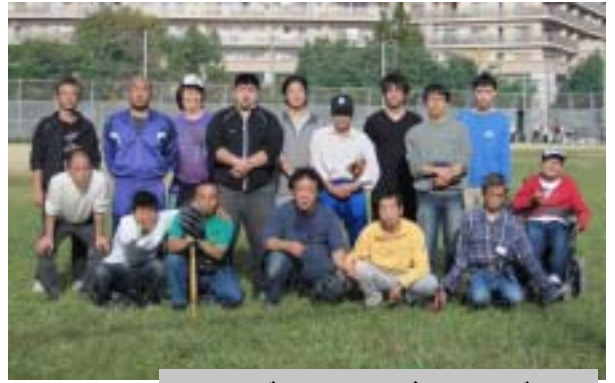
ソフトボールクラブのメンバー

ベリーカップを四月に控え、ソフトボール倶楽部の士気も日に日に高まっています。ベリーカップは、毎年四月に大阪市精神障がい者支援職員連絡協議会の主催で行われる作業所対抗のソフトボール大会です。NPO法人「翔夢」はハートネットとして過去に準優勝の成績を残してきました。そして今年、メンバーが声を掛け合い発足した「翔夢ソフトボール倶楽部」として初優勝を目指します。