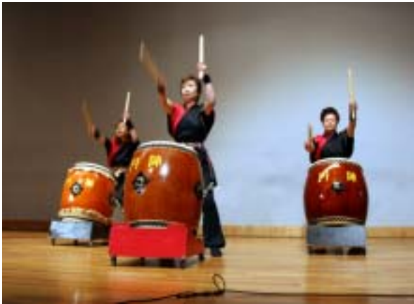
迫力ある和太鼓の演奏