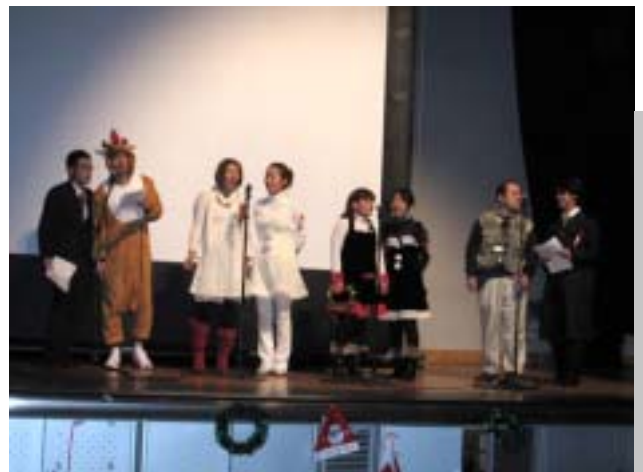
サプライズで職員の歌声も