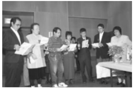
メンバーから唄の贈り物