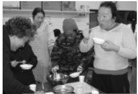
つきたてのもちを食べました

まりの風と寒さの為か、気がつく外でもちを食べる職員、中でもちを食べる利用者の構図になっていました。