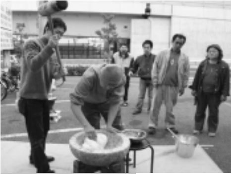
うまくつけるかな？

昨年十二月十四日、強風吹き荒ぶ曇天の中、十二月のレクリエーションとして恒例？になるかもしれない第一回もちつき大会が行われました。