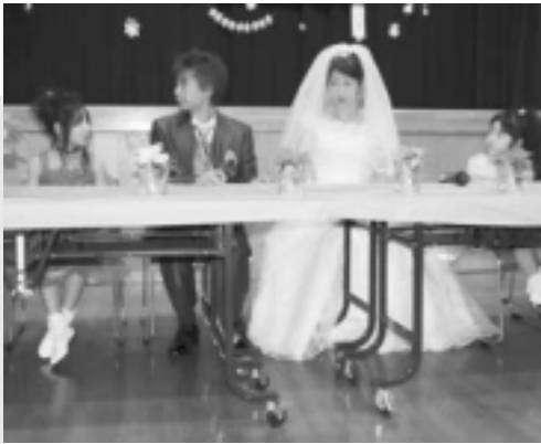
今日は二人が主役です

職員同士がめでたく結ばれ、作業所をあげて祝宴を催すことになりました。短い期間しか無かったのですが、それぞれに時間をみつけては夜遅く