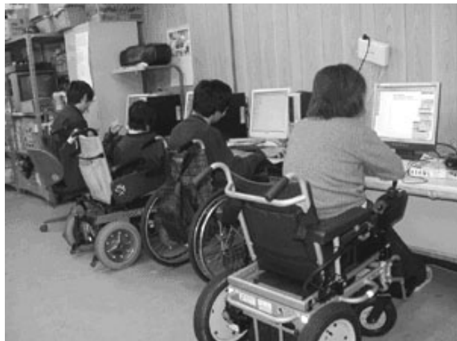
パソコンでの作業

も行っています。利用者と職員の壁を取っ払い、職員と「利用者」が互いに協力しながら運営を進めています。「来るものは拒まず」それがドリームネットのモットーです。一度遊びに来てください。