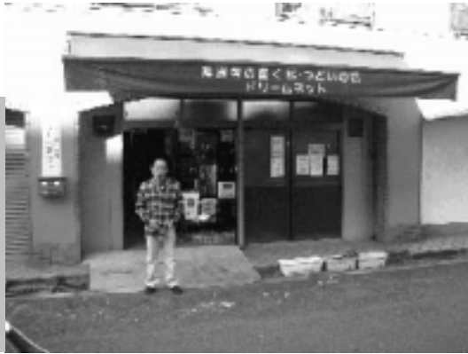
ドリームネットです

ドリームネットは、平成十一年十一月一日に設立、肢体不自由者の作業所としてスタートしました。開所当時は仕事がなく、リサイクル品の販売を中心に活動していましたが、売上げが月に一万円に達することがほとんどなく、パソコンを扱える人も数名という状態でした。また、軽作業もたまに入ってきましたが、手の障害が重く出来なかつたり、短時間しか作業の出来ない方も多くいて肢体不自由者の労働について日々、考えさせられてきました。